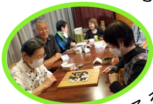
みんなでつくろう